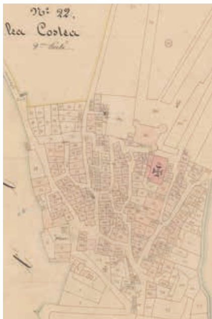
Extrait du cadastre napoléonien : le cœur du village et le château dans la première moitié du XIX e siècle.

Dominant les vallées du Grand Vallat et de la Bastidette, il est situé le long de l'ancienne voie de communication entre Draguignan et la vallée de la Durance. Son emplacement est donc stratégique. Le territoire de Saint Martin est occupé par l'homme dès la Préhistoire. L'habitat est alors situé en hauteur. Au cours de l'Antiquité puis au Moyen Âge, d'importantes fermes sont construites dans la plaine.