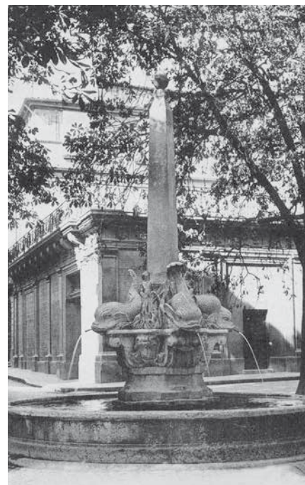
Hôtel de Boisgelin et fontaine des Quatre-Dauphins à Aix-en-Provence.

Ces multiples chantiers villageois provoquèrent dans la région un considérable appel de main-d'oeuvre et de travail. Maçons, jardiniers, ouvriers de tous corps de métiers trouvèrent là, pendant plus d'un siècle, le salaire pour nourrir leur famille. À Saint Martin, cela suscita un développement conséquent du village et explique pour beaucoup le quasi-doublement de la population dans la première partie du XVIII e siècle.