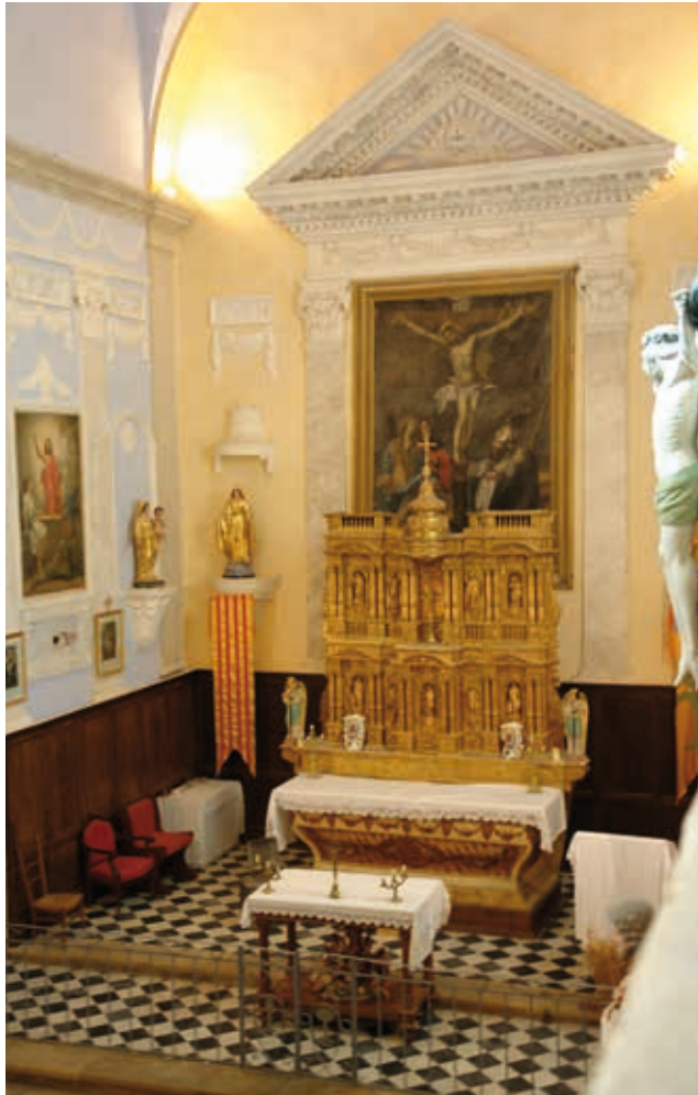
Le choeur de l'église et son retable en bois doré du XVII e siècle.