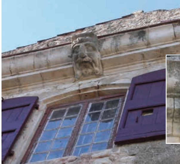
Mascarons du château de Saint-Martin-de-Pallières.