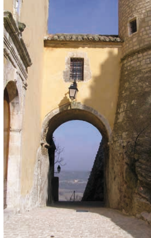
La galerie reliant la nouvelle église (XVII e siècle) au château.

Aux XIX e et XX e siècles, Saint Martin connaît tour à tour son apogée démographique en 1838 avec 472 habitants, l'exode rural à partir de 1841 puis un renouveau à la fin du XX e siècle, dû