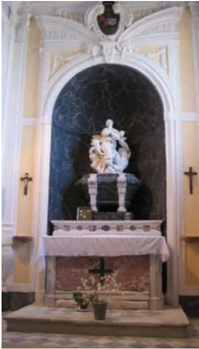
Le groupe de l'Assomption dans la chapelle de la Vierge.